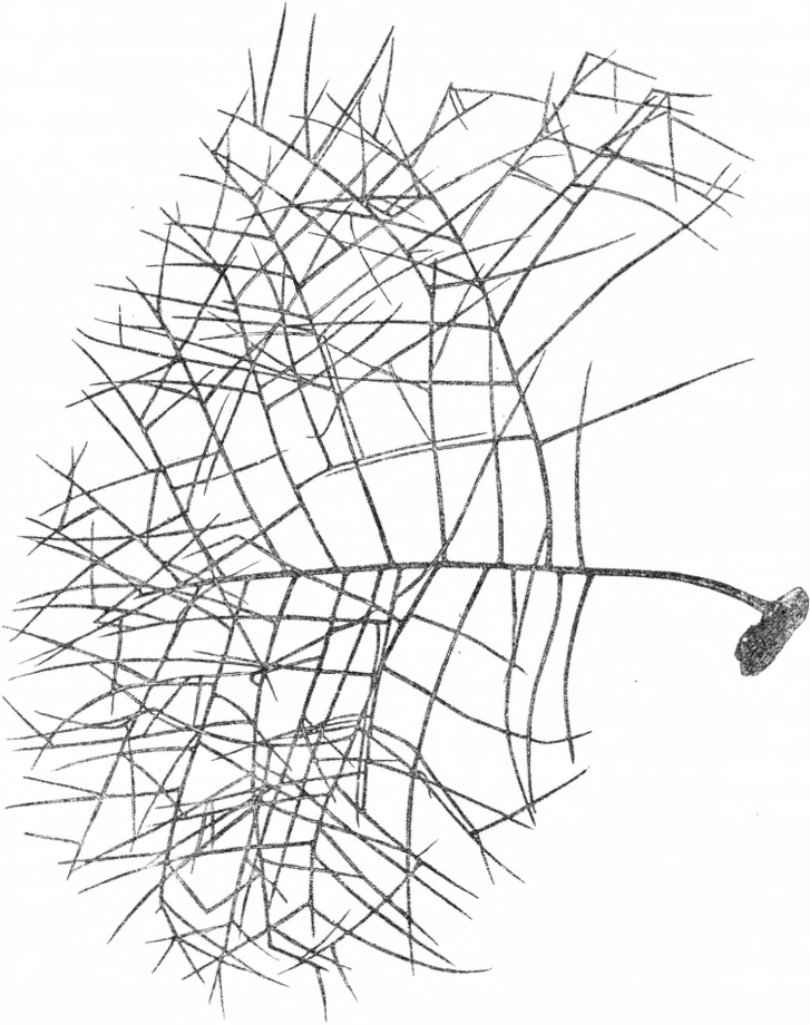
Antipathes arctica Ltk. (noget formindsket).